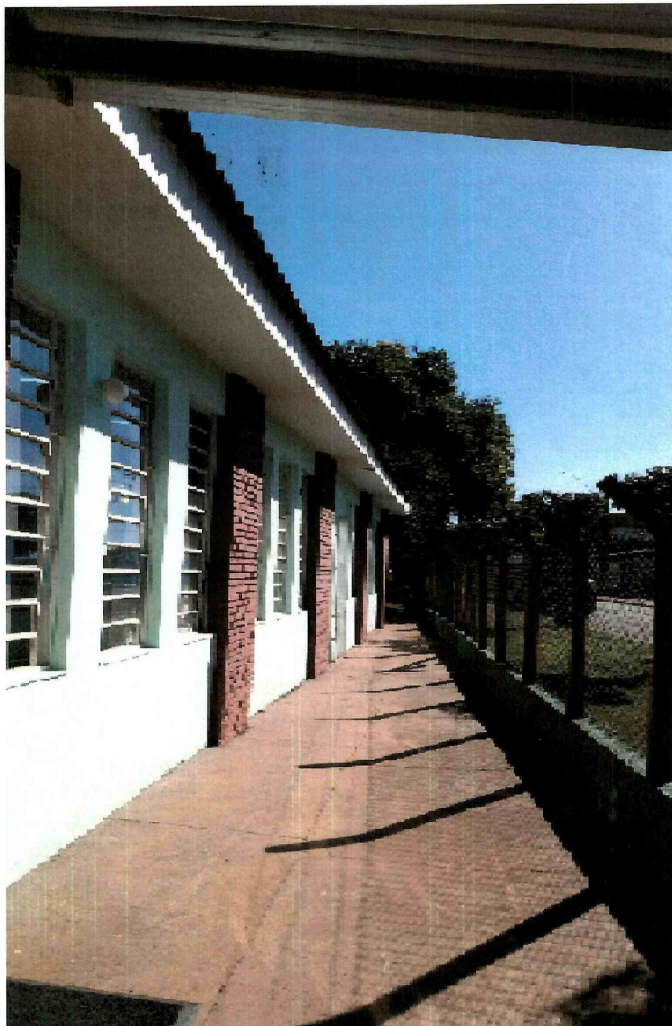
IMAGEM DO LOCAL ONDE A COBERTURA SERÁ INSTALADA