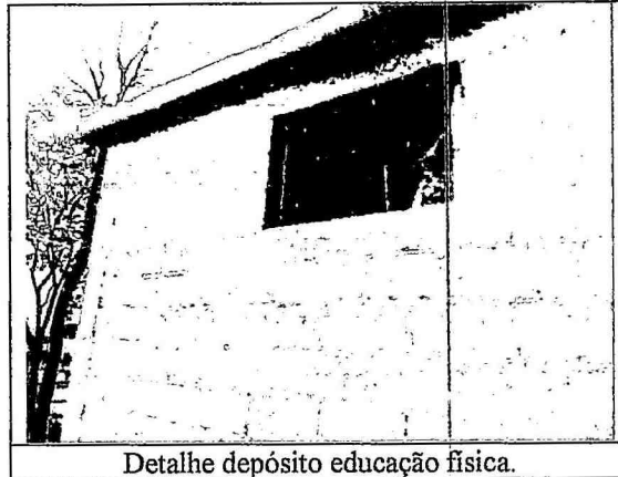
Detalhe depósito educação física.

Este documento refere-se a Emenda Impositiva, reforma do depósito de Educação Física.